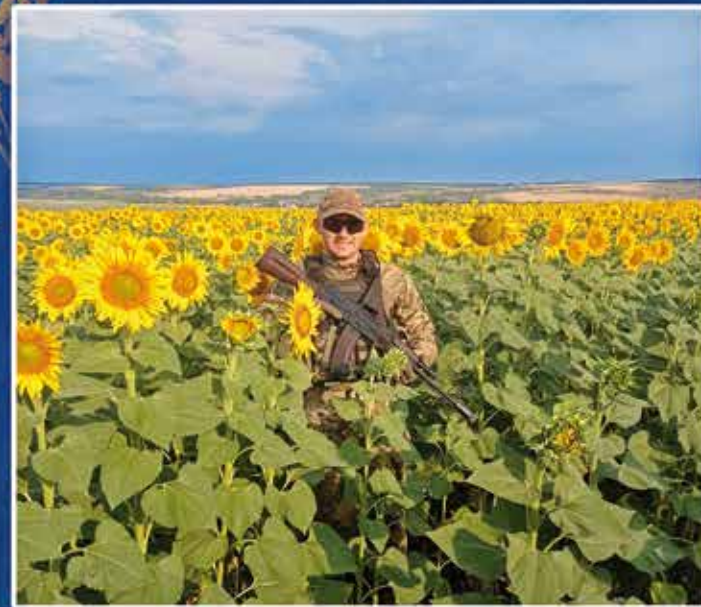
Український воїн в безкраїх полях соняхів на сході України. Серпень 2022 р.