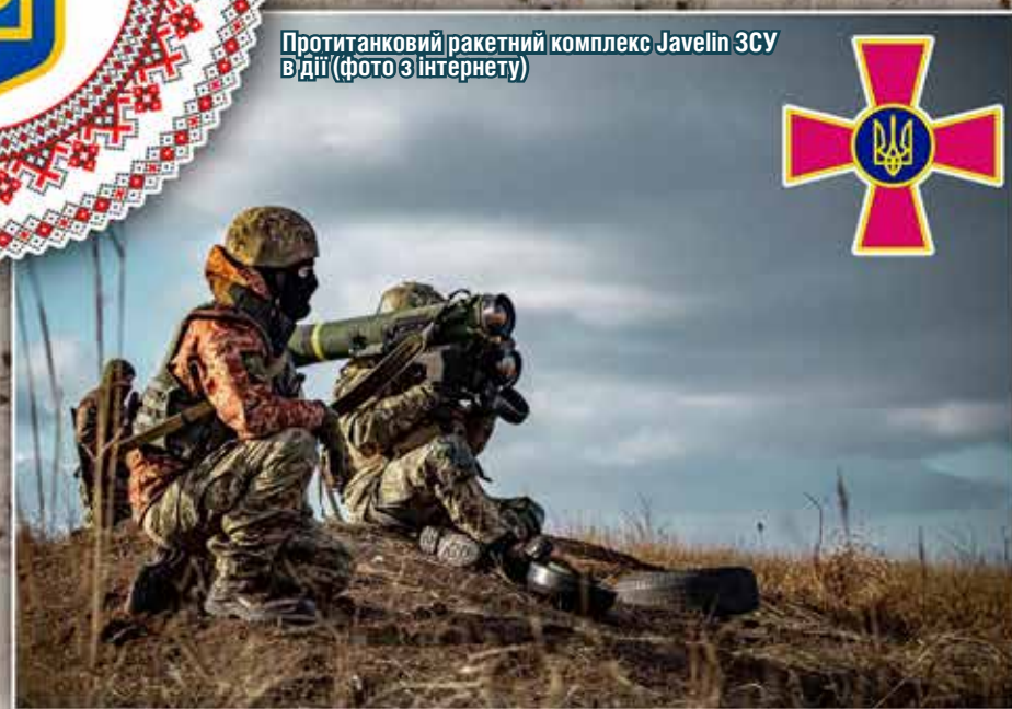
Протитанковий ракетний комплекс Javelin ЗСУ в дії