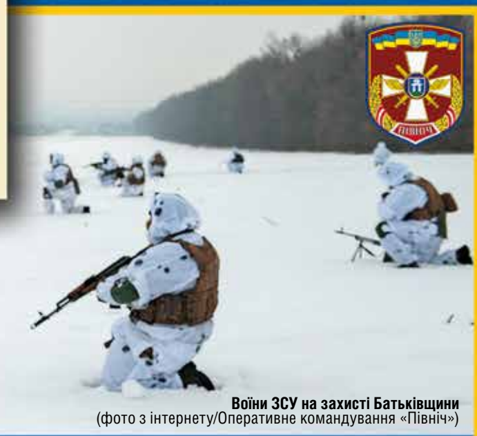
Воїни ЗСУ на захисті Батьківщини