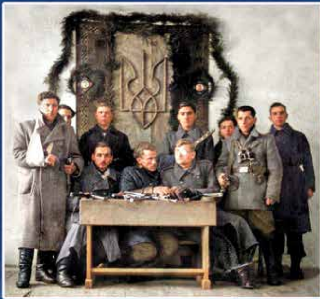
Свято Зброї в сотні «Ударник-4» («У-4», вл. 94а) Перемиського куреня ВО-6 «Сян» УПА-Захід. Перемищина, 1946 р.