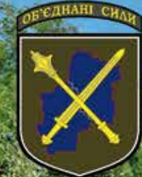
Самохідна артилерійська установна «Краб» в Україні. Червень, 2022 (фото з інтернету// Угрупування Об'єднаних Сил)