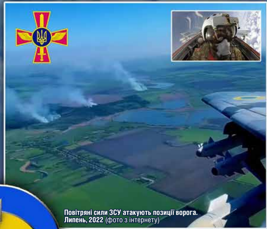
Повітряні сили ЗСУ атакують позиції ворога. Липень, 2022