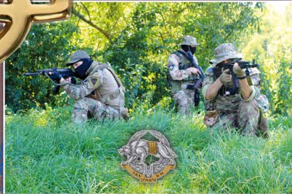
Воїни Сил спеціальних операцій Збройних сил України на захисті Батьківщини