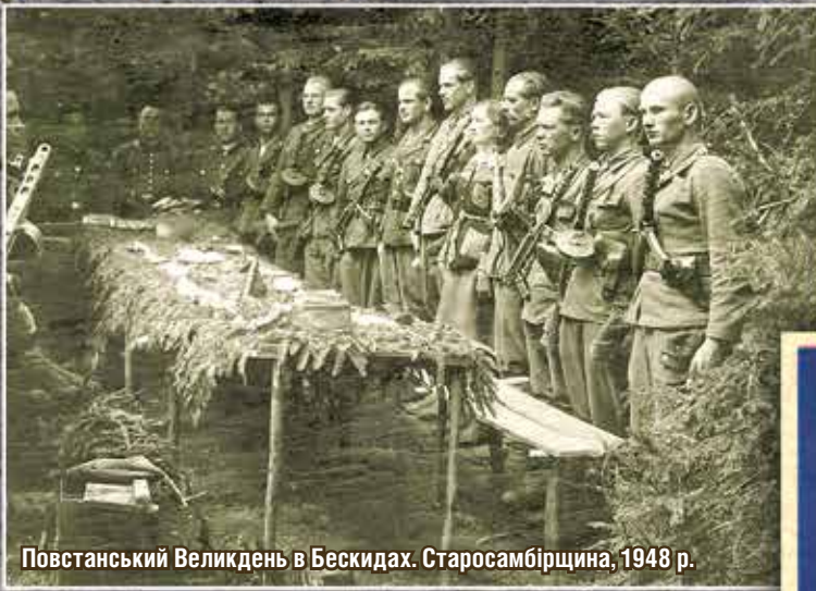
Повстанський Великдень в Бескидах. Старосамбірщина, 1948 р.