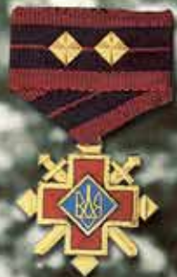
Золотий Хрест Бойової Заслуги УПА