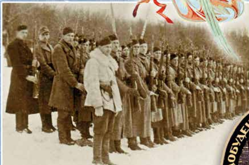
Повстанці ВО-3 «Лисоня» УПА-Захід. Зима 1943/44 рр.

З огляду на передбачувану російську агресію країнами блоку НАТО в січні 2022 р. була надана Україні вагома збройна допомога безпілотниками «Байрактар ТБ2» і іншими БПЛА, ПТРК «Джавелін», ПЗРК «Стінгер», ПЗРК «Гром», гелікоптерами Мі-17В5 та Мі-8МТВ, легкими мінометами, кулеметами, снайперськими гвинтівками, приладами нічного бачення, тепловізорами, протикорабельними ракетами, стрілецькою та артилерійською амуніцією, захисним екіпуванням для воїнів, польовими шпиталями, медикаментами та іншими засобами, необхідними в часі воєнних дій.