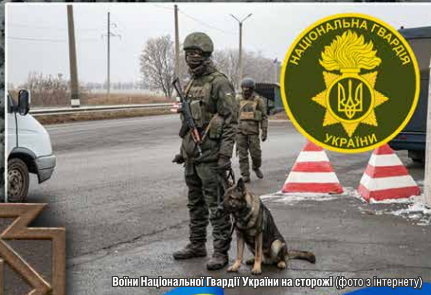
Воїни Національної Гвардії України на сторожі