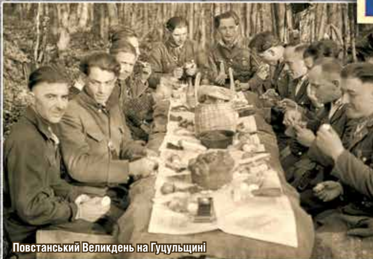
Повстанський Великдень на Гуцульщині