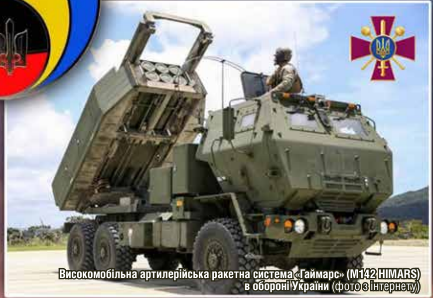
Високомобільна артилерійська ракетна система «Гаймарс» (M142 HIMARS) в обороні України (фото з інтернету)