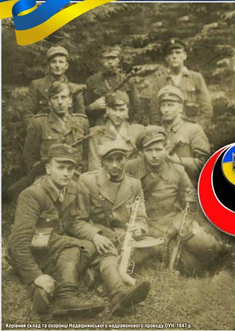
Керівний склад та охоронці Надвірнянського надрайонного проводу ОУН. 1947 р.