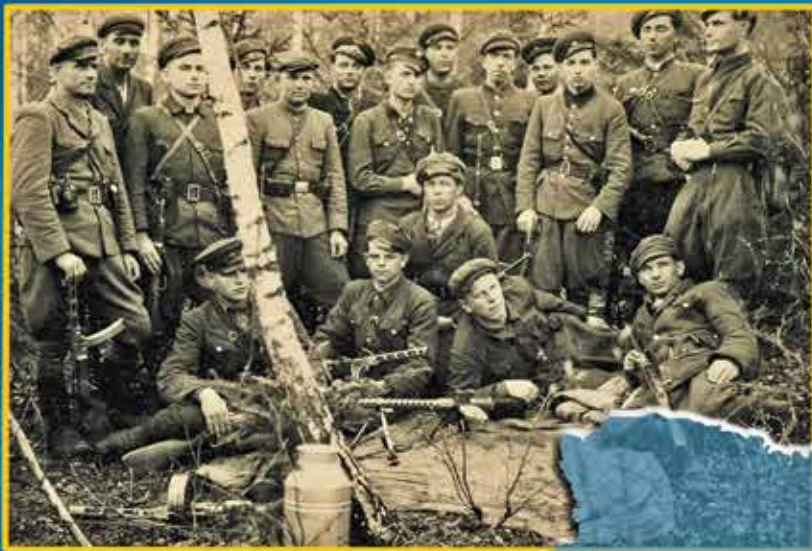
Підпільники Коломиїської округи ОУН. 20 квітня 1949 р.