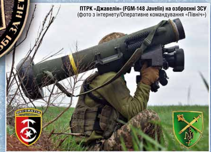
ПТРК «Джавелін» (FGM-148 Javelin) на озброєнні ЗСУ