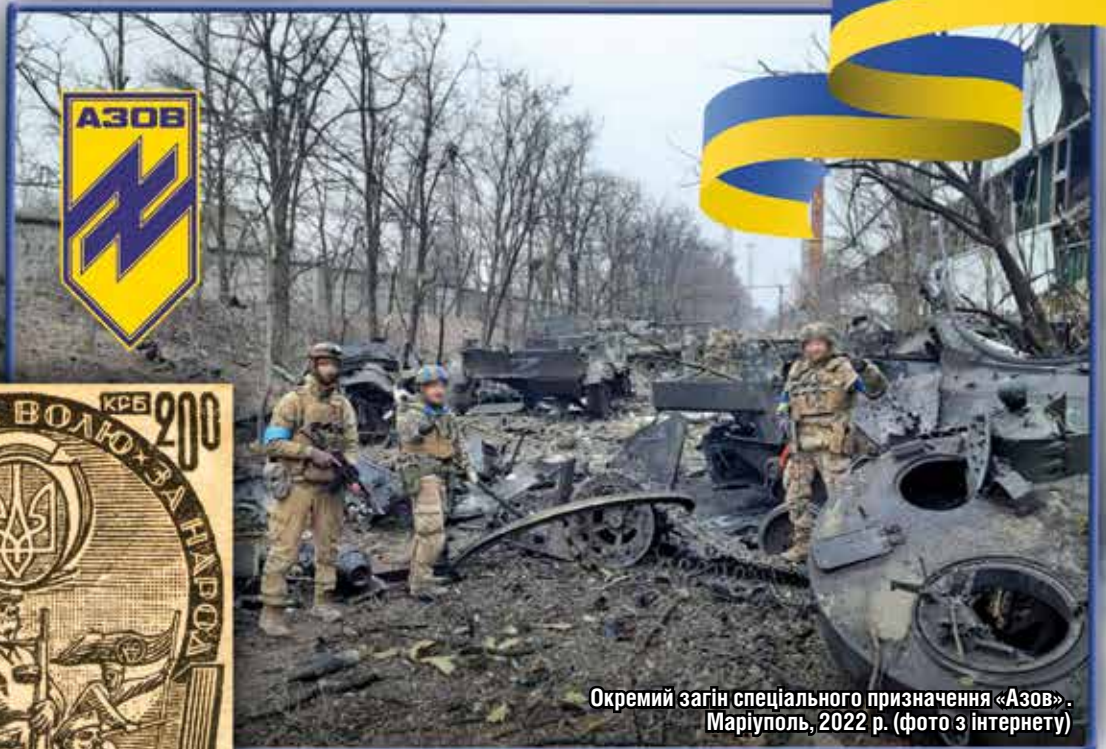
Окремий загін спеціального призначення «Азов». Маріуполь, 2022 р.