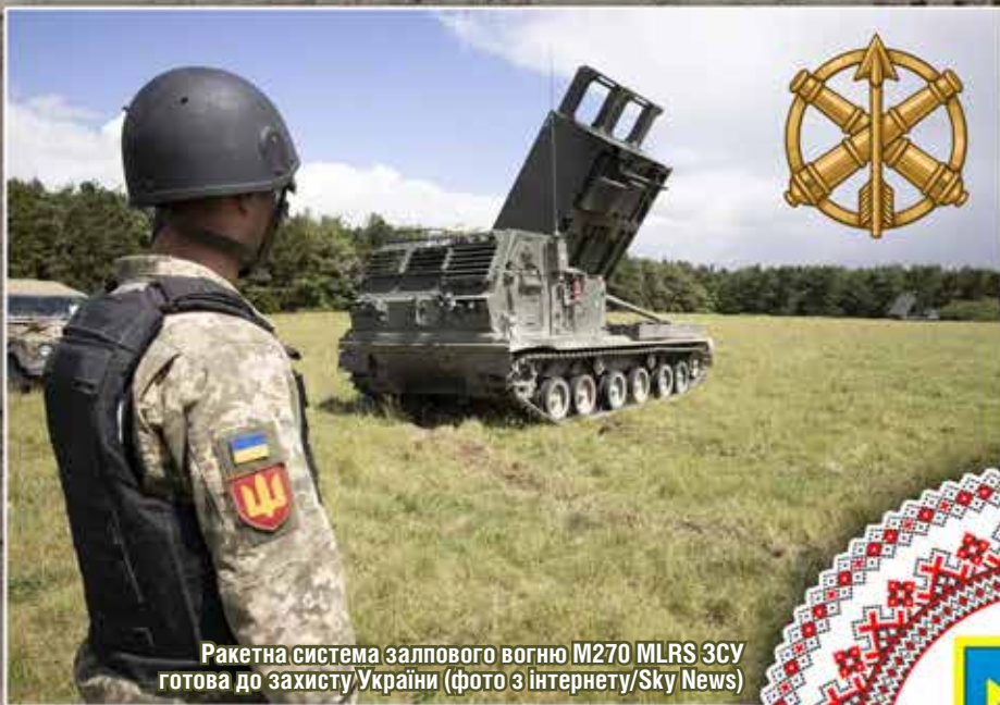
Ракетна система залпового вогню M270 MLRS ЗСУ готова до захисту України