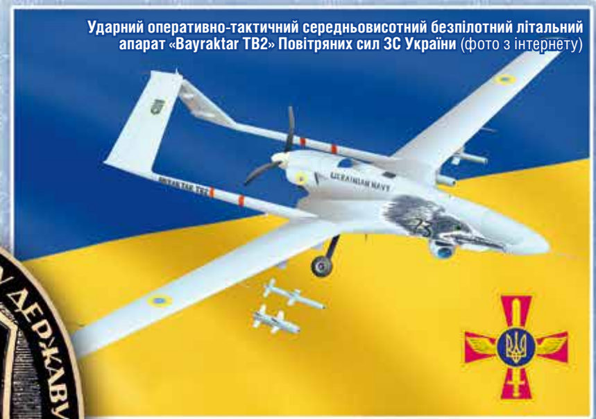
Ударний оперативно-тактичний середньовисотний безпілотний літальний апарат «Bayraktar TB2» Повітряних сил ЗС України