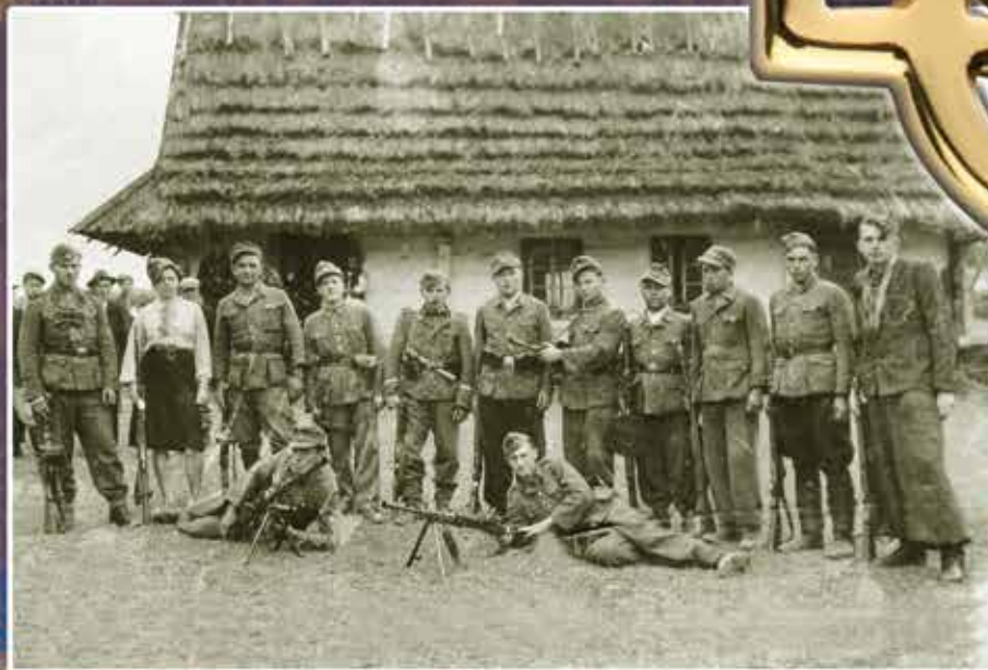
Свято Зброї на хут. Заясенів с. Яблунів, Турківщина. 31 серпня 1944 р.