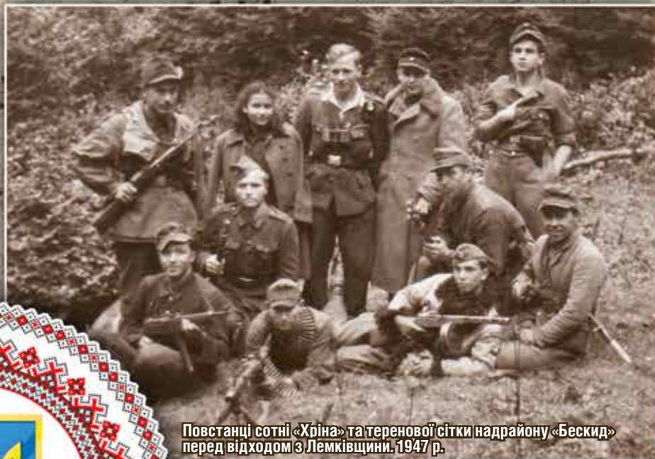
Повстанці сотні «Хріна» та теренової сітки надрайону «Бескид» перед відходом з Лемківщини, 1947 р.