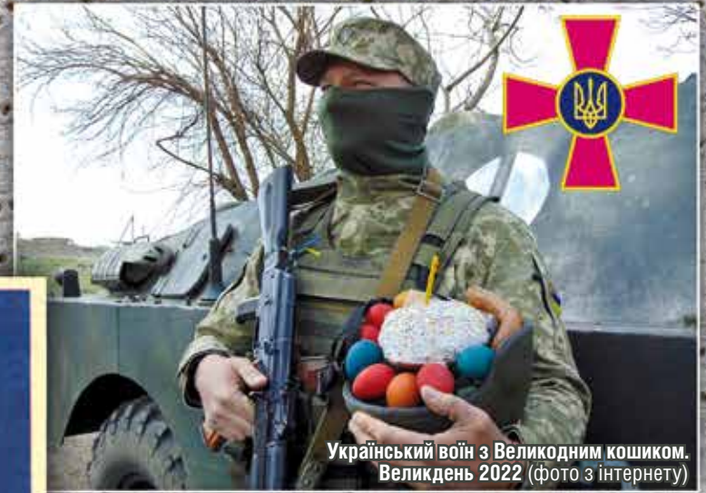
Український воїн з Великоднім кошиком. Великдень 2022