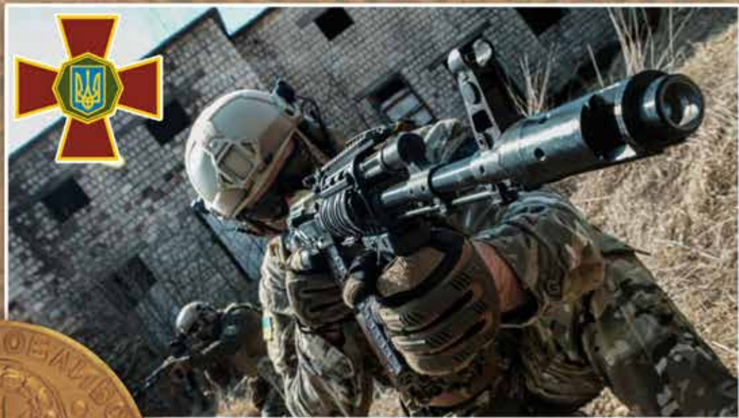
ЗСУ і НГУ на захисті Батьківщини від російської агресії