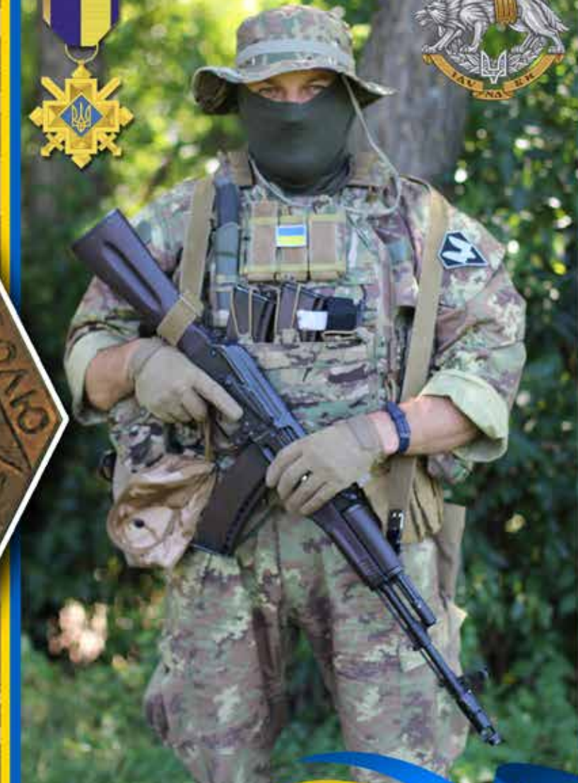
Воїн Сил спеціальних операцій (ССО) ЗСУ