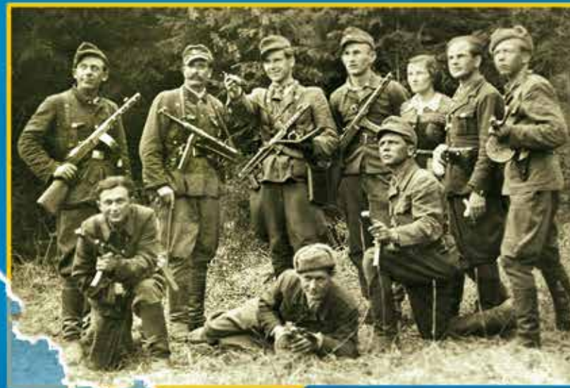
Стрільці сотні «Стаха» та підпільники теренової сітки. Старосамбірщина, 1948 р.