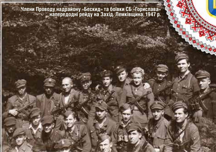
Члени Проводу надрайону «Бескид» та бойки СБ «Горислава» напередодні рейду на Захід, Лемківщина, 1947 р.