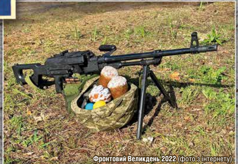
Фронтвий Великдень 2022