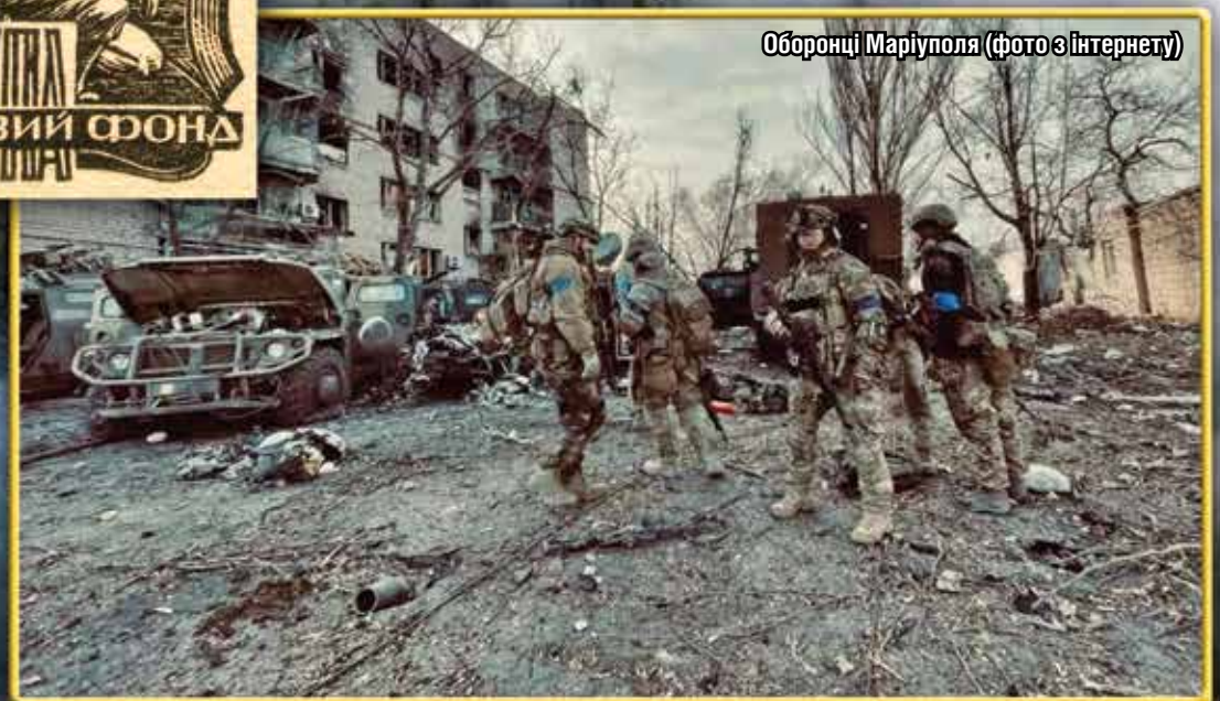
Оборонці Маріуполя