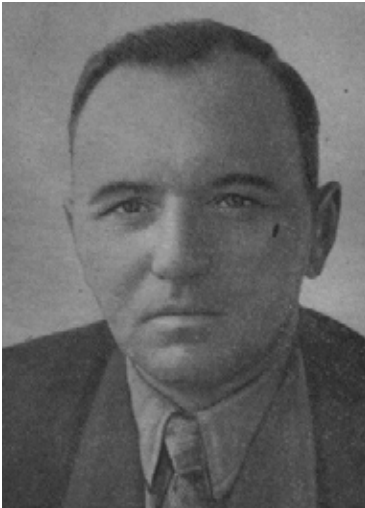
Василь Кук, 1960 р.