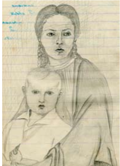
Рисунок роботи Уляни Крюченко