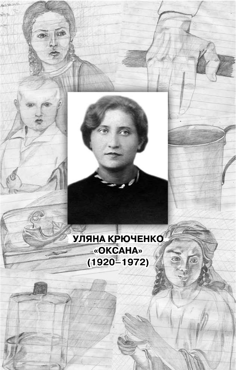
УЛЯНА КРЮЧЕНКО «ОКСАНА» (1920–1972)