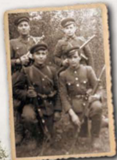
Неідентифіковані повстанці з Мостицини