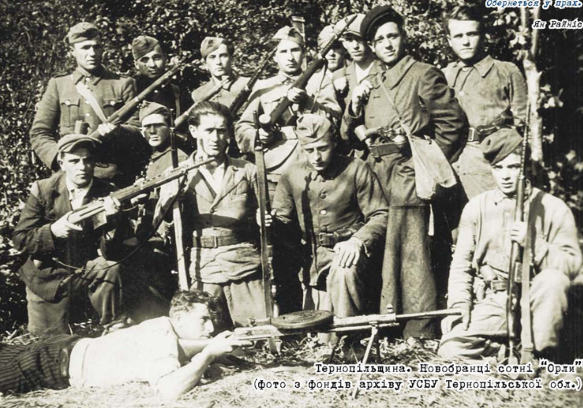
Тернопільщина. Новобранці сотні "Орли"