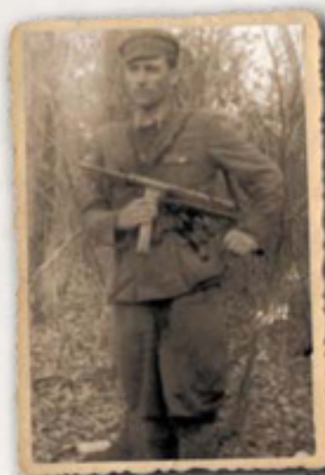
Неідентифікований повстанець з Мостицини