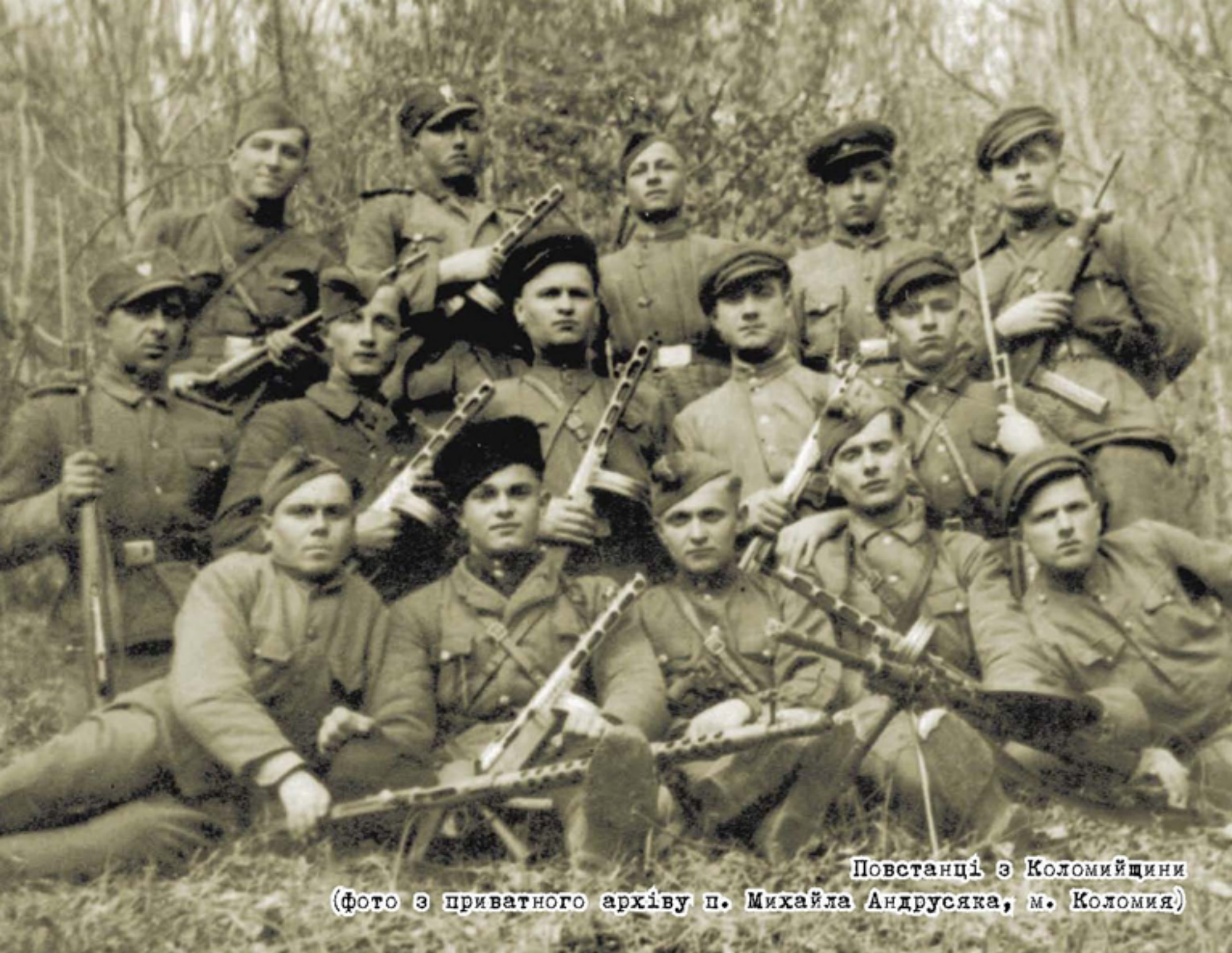
Повстанці з Коломиїщини