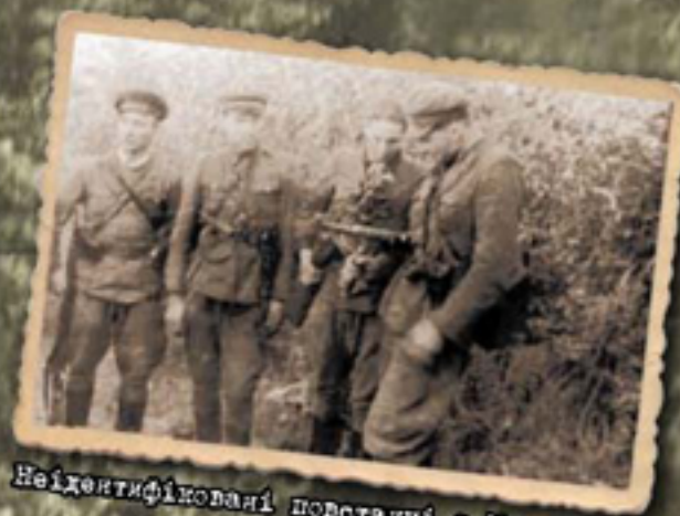
Неідентифіковані повстанці з Мостищини