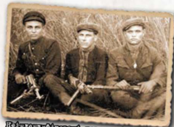
Неідентифіковані повстанці