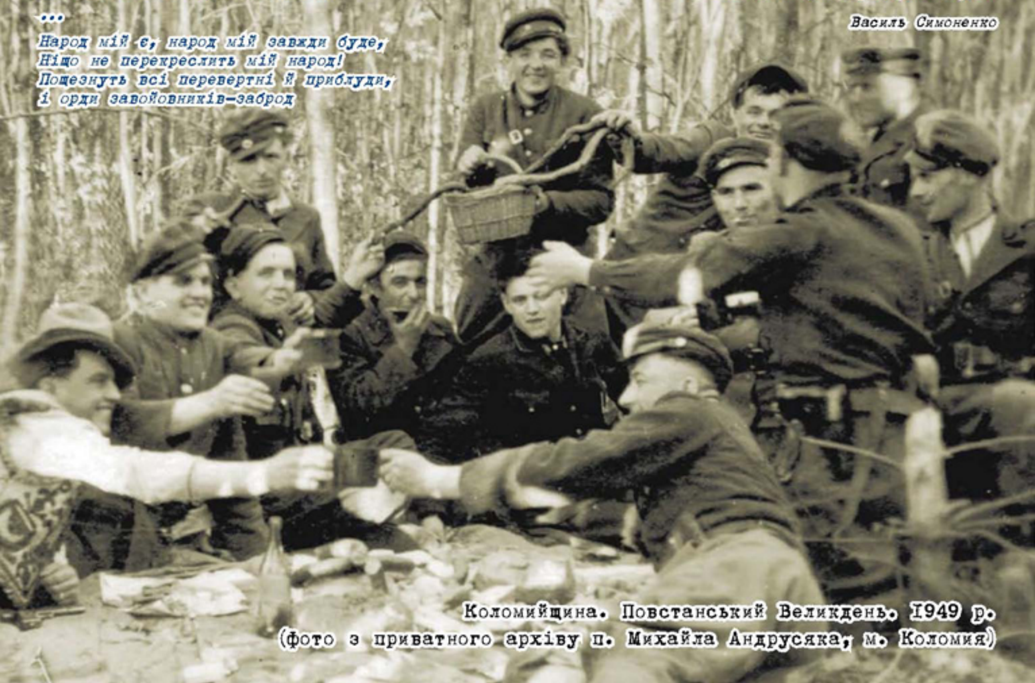
Коломиїщина. Повстанський Великдень. 1949 р.